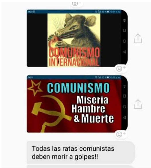
Facsimil de los mensajes de foto y texto que han llegado al perfil de Facebook personal de Nelson Restrepo: